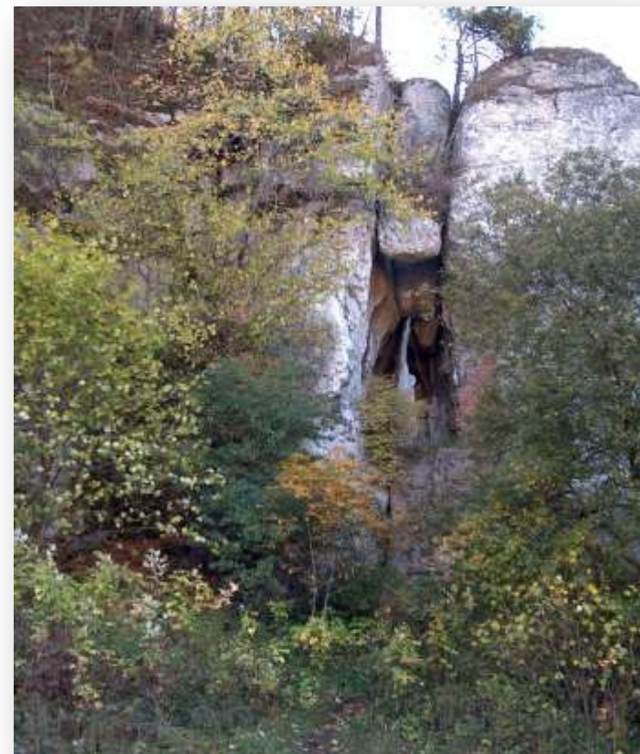
Skala Biśnik z Jaskinią Biśnik