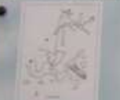
Skala w Skale Biśnik