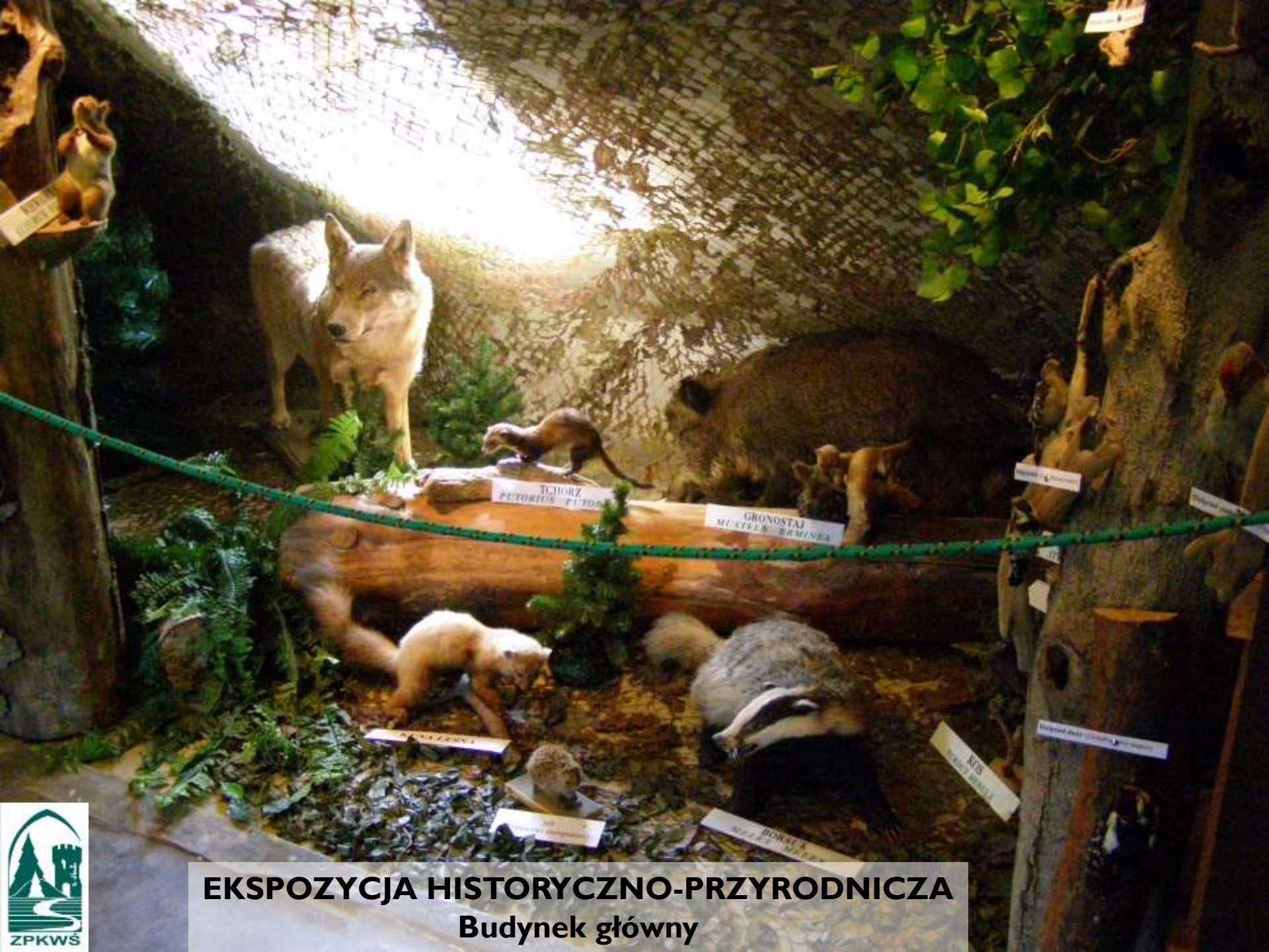
EKSPOZYCJA HISTORYCZNO-PRZYRODNICZA Budynek główny