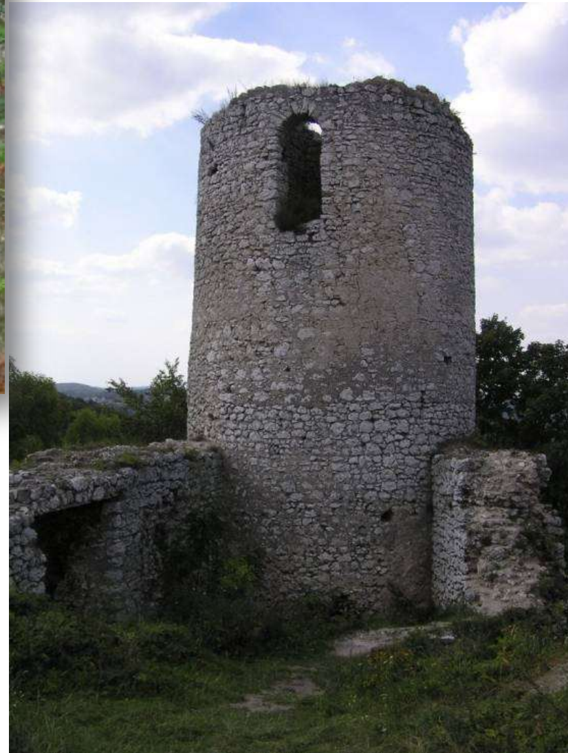
Ruiny zamku Smoleń