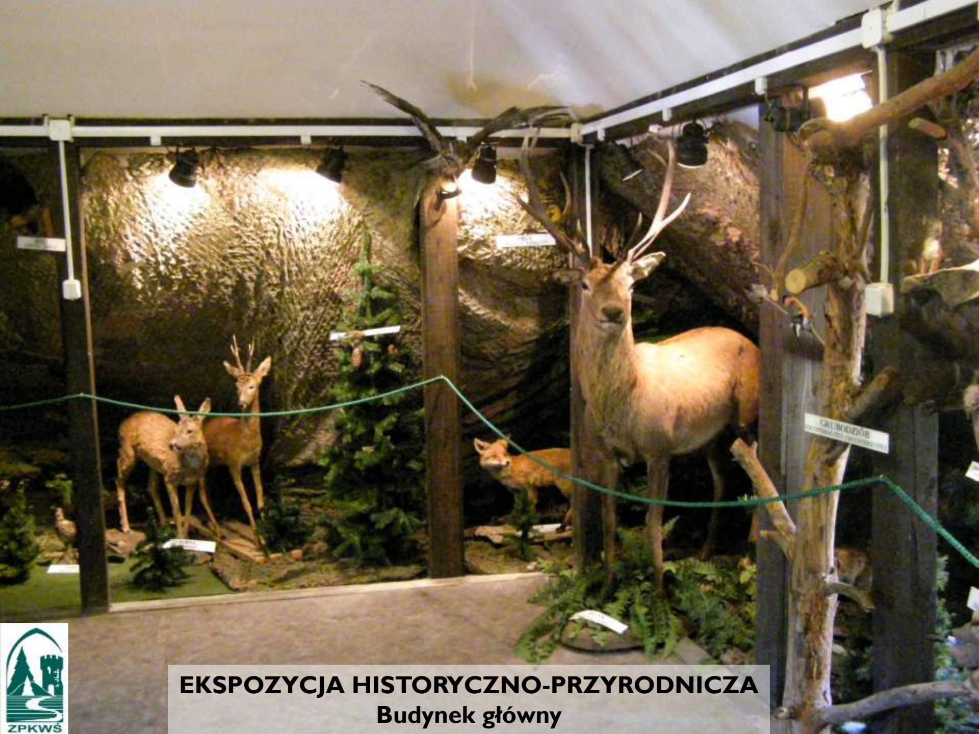
EKSPOZYCJA HISTORYCZNO-PRZYRODNICZA Budynek główny