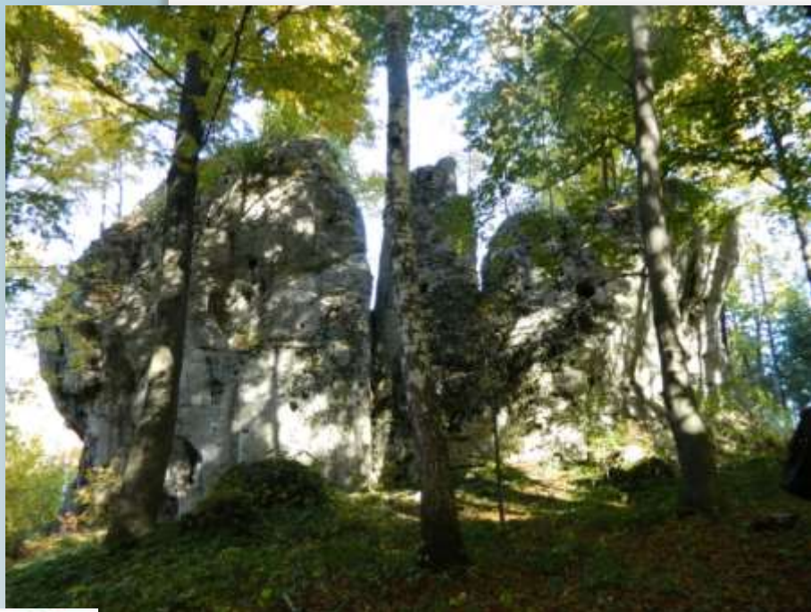
Skala „Oczko” na terenie „Doliny Wodącej”

Ośrodek Edukacyjno-Naukowy ZPKWŚ w Smoleniu (funkcjonujący przy Oddziale Biura ZPKWŚ) zlokalizowany jest na Wyżynie Krakowsko-Wieluńskiej, w Paśmie Smoleńsko-Niegowonickim na terenie Doliny Wodącej , jednej z najbardziej malowniczych w Parku Krajobrazowym Orlich Gniazd . Otoczenie stwarza doskonałe warunki do prowadzenia edukacji, uprawiania turystyki i rekreacji .