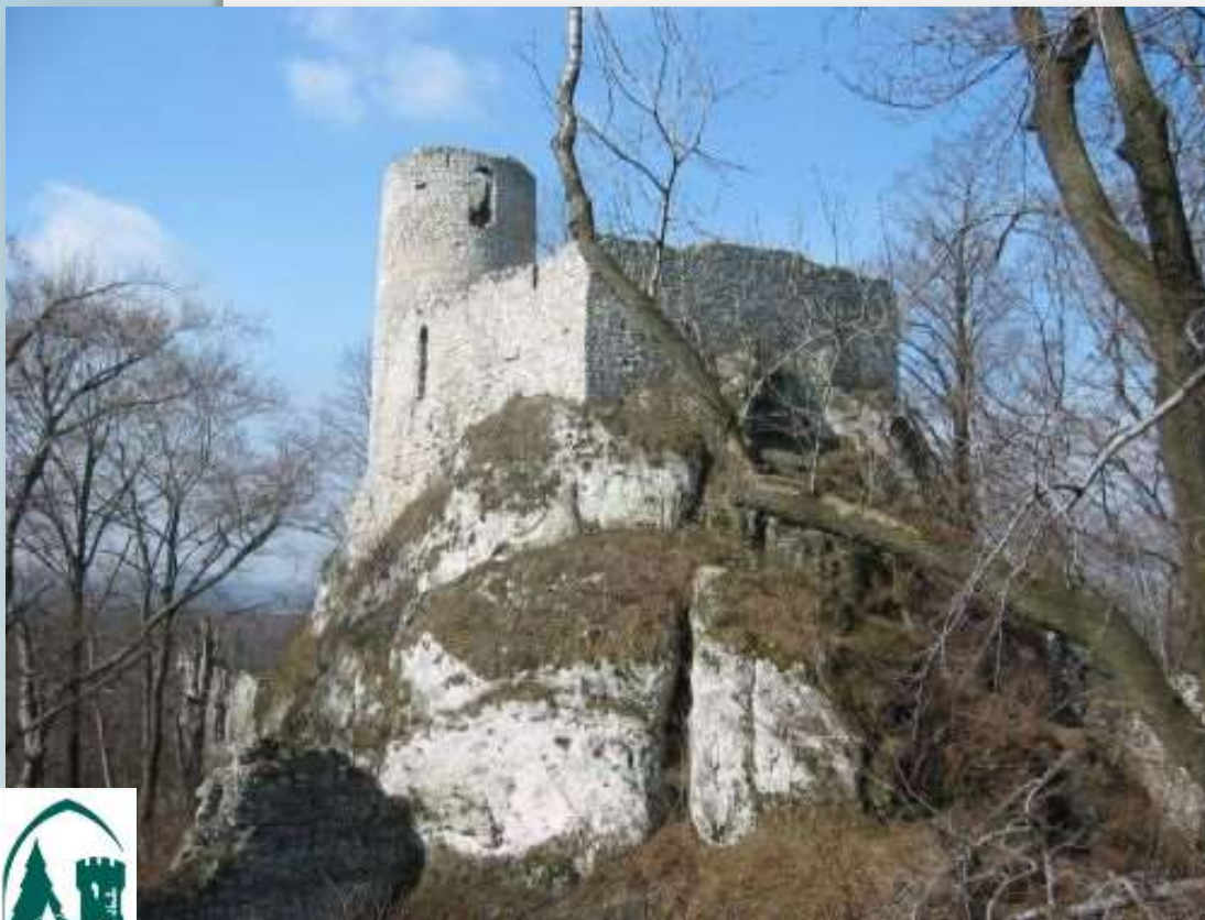
Ruiny zamku Smoleń

W bliskim sąsiedztwie Ośrodka można obejrzeć wiele cennych obiektów przyrodniczych i historycznych, m.in.: rezerwat przyrody „Smoleń” z ruinami średniowiecznego zamku, wiele form krasowych w postaci ostańców skalnych i jaskiń, stanowiska archeologiczne i formy ochrony przyrody . Dodatkowym atutem położenia Ośrodka jest interesująca fauna i flora, które charakteryzują się wieloma rzadkimi i chronionymi gatunkami.