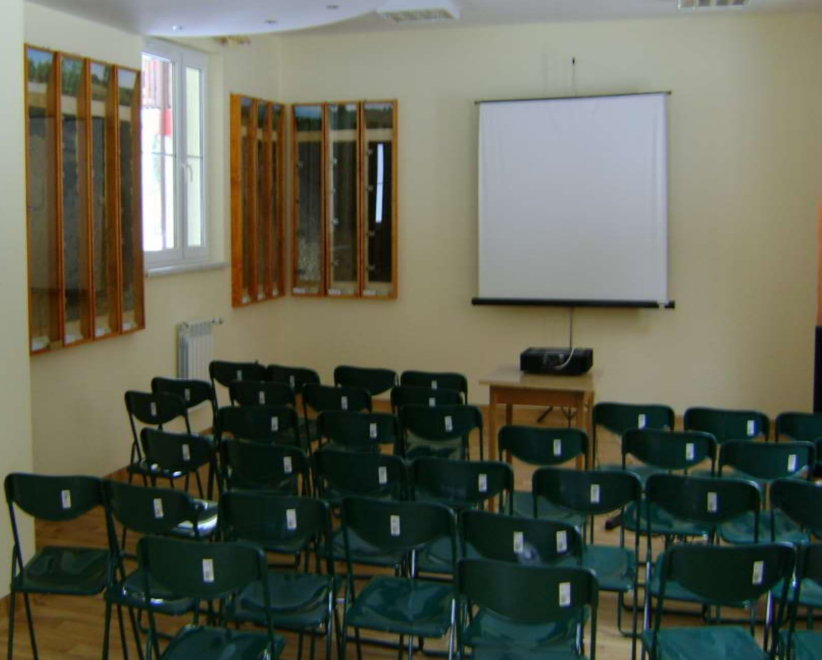
SALA DYDAKTYCZNA Kompleks noclegowo-edukacyjny „Jurajska Ostoja”