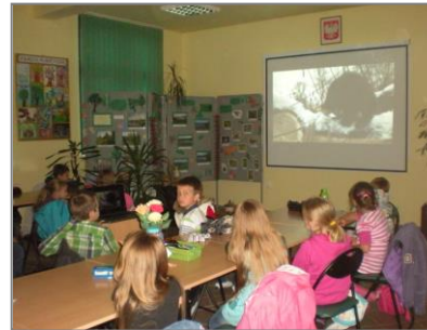
Zajęcia stacjonarne w Sali edukacyjnej

Krajobrazowe Polski ), a także wiele innych ciekawych zajęć. Oferta edukacyjna ośrodka obejmuje płatne oraz bezpłatne formy zajęć szczególnie tematyka zajęć oraz cennik znajduje się na stronie internetowej ZPKWŚ.