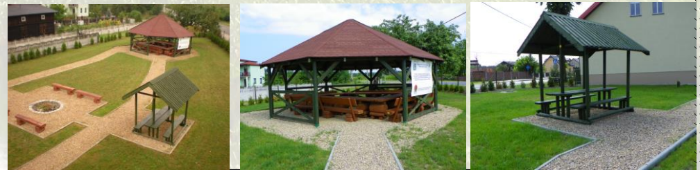
Teren przy Ośrodku Edukacyjnym ZPKWŚ w Kalinie