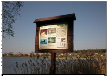
Ścieżka dydaktyczna Kalina-Olszyna

Krajobrazowy „Lasy nad Górną Liswartą” obejmuje ochroną najcenniejsze fragmenty terenów znajdujących się w górnym odcinku rzeki Liswarty.