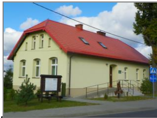
Oddział ZPKWŚ w Kalinie

Ośrodek Edukacyjny Zespołu Parków Krajobrazowych Województwa Śląskiego w Kalinie (zlokalizowany w centralnej części Parku Krajobrazowego „Lasy nad Górną Liswartą” ) utworzony został przy Oddziale Biura ZPKWŚ w Kalinie w celu prowadzenia edukacji ekologicznej. Tematyka wiodąca Ośrodka to przyroda obszarów wodno-błotnych. Park